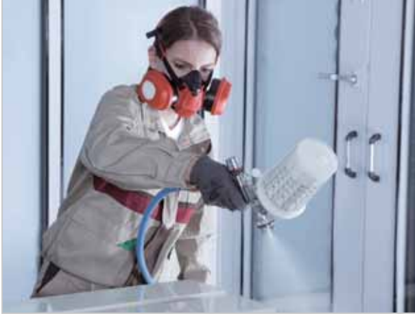
Široké spektrum trysek u SATAjet 1000 B činí pistoli všestranně použitelnou.